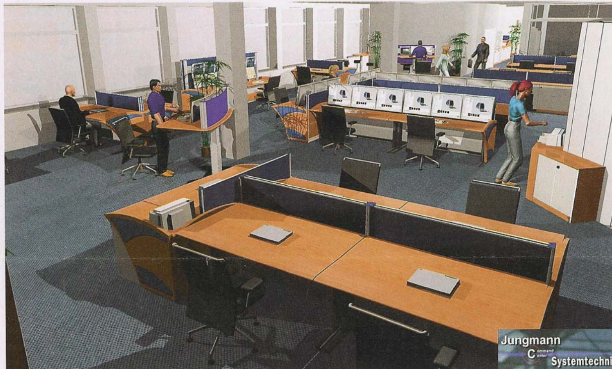
Erste Eindrücke des Nord- und Südflügels des neuen EOC First impressions of the Northern and Southern wing of the new EOC