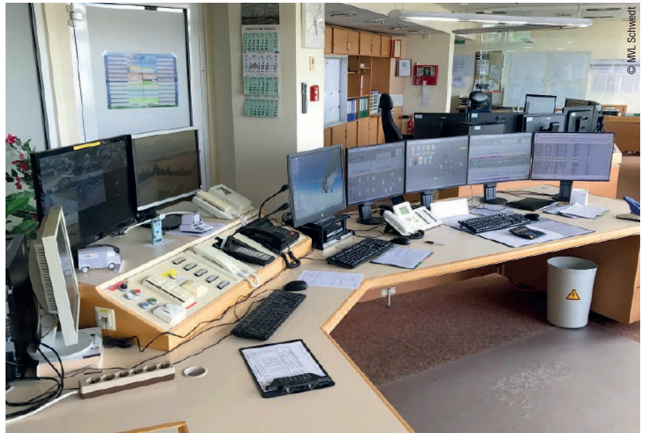
Abb. 2: Bis vor kurzem waren die Operatoren in dieser 20 Jahre alten Leitwarte untergebracht. Zuletzt gab es pro Arbeitsplatz acht Bildschirme, um die steigenden Aufgaben der Leitwarte zu bewältigen.