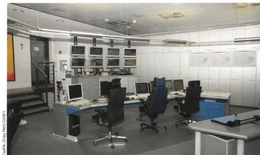
Bild 1. Die alte Leitstelle wurde rund 20 Jahre lang im 24/7-Betrieb genutzt, genügte aber bald den zunehmenden Ansprüchen an Ergonomie und Arbeitskomfort nicht mehr.

Bis April 2019 steuerte der Verteilnetzbetreiber Ovag Netz GmbH sein Mittelspannungs- und Wasserübertragungsnetz von einer im Jahr 1997 entstandenen Leitstelle aus (Bild 1). Da die Anforderungen an Technik und Einrichtung sowie das Aufgabenspektrum im Laufe der Jahre deutlich gestiegen waren, entschieden sich die Verantwortlichen für eine komplette Modernisierung und Neugestaltung der Räumlichkeiten. Mit der Ausführungsplanung sowie mit der Realisierung der Wartentechnik wurde die Jungmann Systemtechnik GmbH & Co. KG (JST) beauftragt, die einen Kontrollraum mit neuer Raumaufteilung und zwölf ergonomischen Arbeitsplätzen umsetzte (Bild 2). Auf den Arbeitsplatzmonitoren sowie der eventgesteuerten Videowall mit zwölf Großbildcubes können nun mittels einer speziellen Multi-Consoling-Technik die verschiedenen Überwachungssysteme für alle Anlagen flexibel aufgerufen und bedient sowie Alarmer angezeigt werden. Insgesamt sorgen Einrichtung und Technik für ein angenehmes Arbeitsumfeld und schnellere Reaktionszeiten der Mitarbeiter.