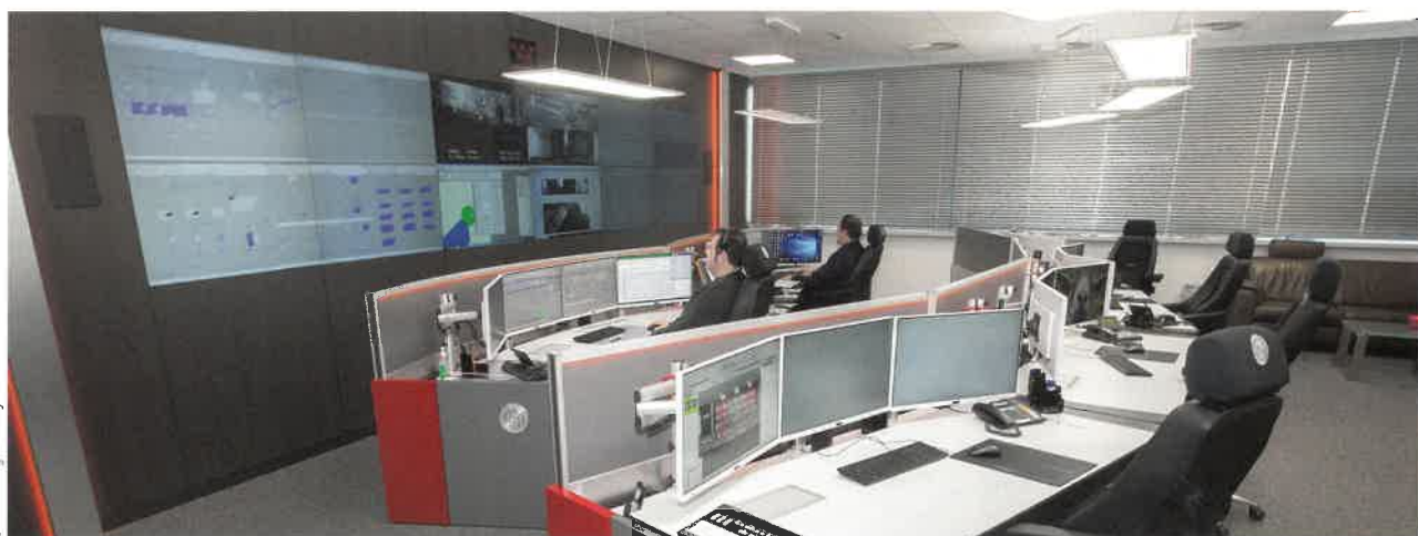
Bild 2. Nach der Neugestaltung durch JST gibt es nun zwölf Arbeitsplätze, die auf unterschiedliche, neu konzipierte Räume verteilt sind. Sechs davon befinden sich im eigentlichen Wartenraum.

Netzfürung bei der Ovag Netz GmbH. »Die Leitstelle wurde von da an rund 20 Jahre lang im 24/7-Betrieb genutzt, genügte aber relativ bald nicht mehr den zunehmenden Ansprüchen an Ergono-