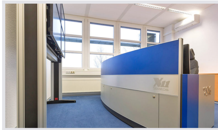
JST Leitstandtische: Der Stratos X11 OperatorDesk – hier in der Ausführung „Curve“ – erfüllt ergonomisch wie optisch höchste Ansprüche.