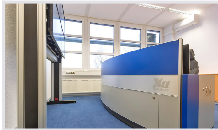
JST Leitstandtische: Der Stratos X11 OperatorDesk – hier in der Ausführung „Curve“ – erfüllt ergonomisch wie optisch höchste Ansprüche.