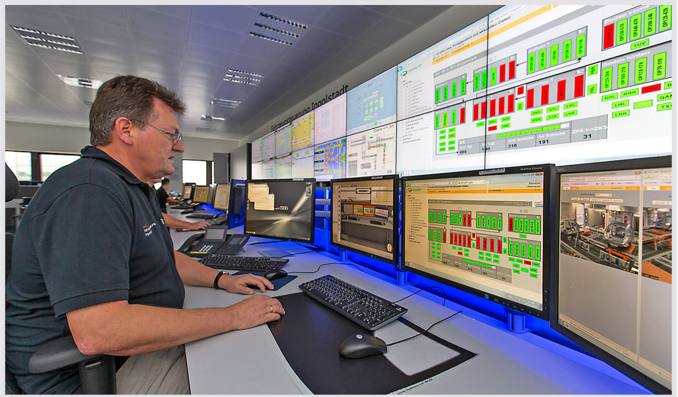
Audi Ingolstadt: Leitstand von JST

Stilvolle Limousinen, sportliche Allroader und schnittige Coupés – mehr als 2.500 Automobile laufen im Audi-Werk Ingolstadt täglich vom Band, im Jahr 2013 wurden hier mehr als 570.000 Autos produziert. Damit die Produktion niemals zum Stehen kommt, sorgen mehr als 30 Mitarbeiter in drei Schichten für einen reibungslosen Ablauf. Jungmann Systemtechnik – JST – hat dafür die idealen Rahmenbedingungen geschaffen. Im Ingolstädter Audi-Werk wurde ein zukunftsweisender Leitstand installiert, der es ermöglicht, die gesamte Fabrikation der verschiedenen Modellreihen über virtuelle IT-Technik zu steuern. Ein Novum im Volkswagen Konzern, in dem der neue Leitstand eine vielbeachtete Vorreiter-Rolle einnimmt.