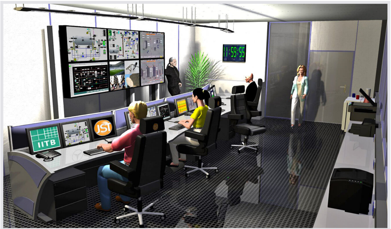
Daimler Bremen: Neue Produktionswarte. Photorealistische 3D-Planung.

Im Mercedes-Benz Werk Bremen werden die C-Klasse Modelle und die Roadster der Baureihen SL und der SLK sowie der CLK gebaut. Das Presswerk im Werk Bremen fertigt dafür die anspruchsvollen Karosserieteile. Eine der modernsten Produktionswarten wurde in Bremen im Presswerk in Betrieb genommen. Von hier aus werden alle Prozesse der Pressteilfertigung überwacht sowie die Platinenversorgung und die Verschnittensorgung gesteuert.