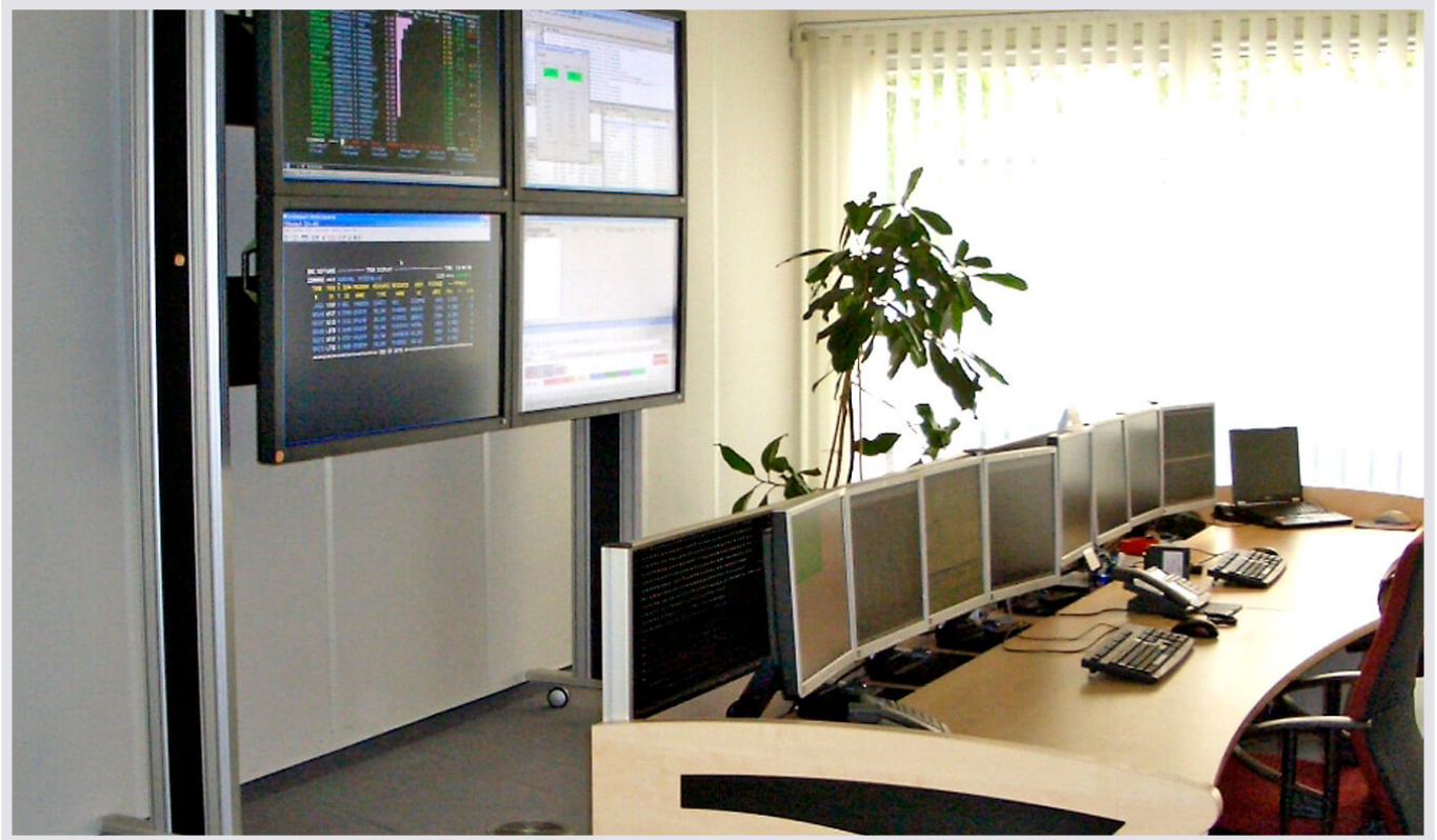
Deutscher Ring in Hamburg - Systems-Management-Leitstand von JST

Der Deutsche Ring überwacht Mainframe und dezentrale Systeme aus dem neu konzipierten Systems-Management-Leitstand .