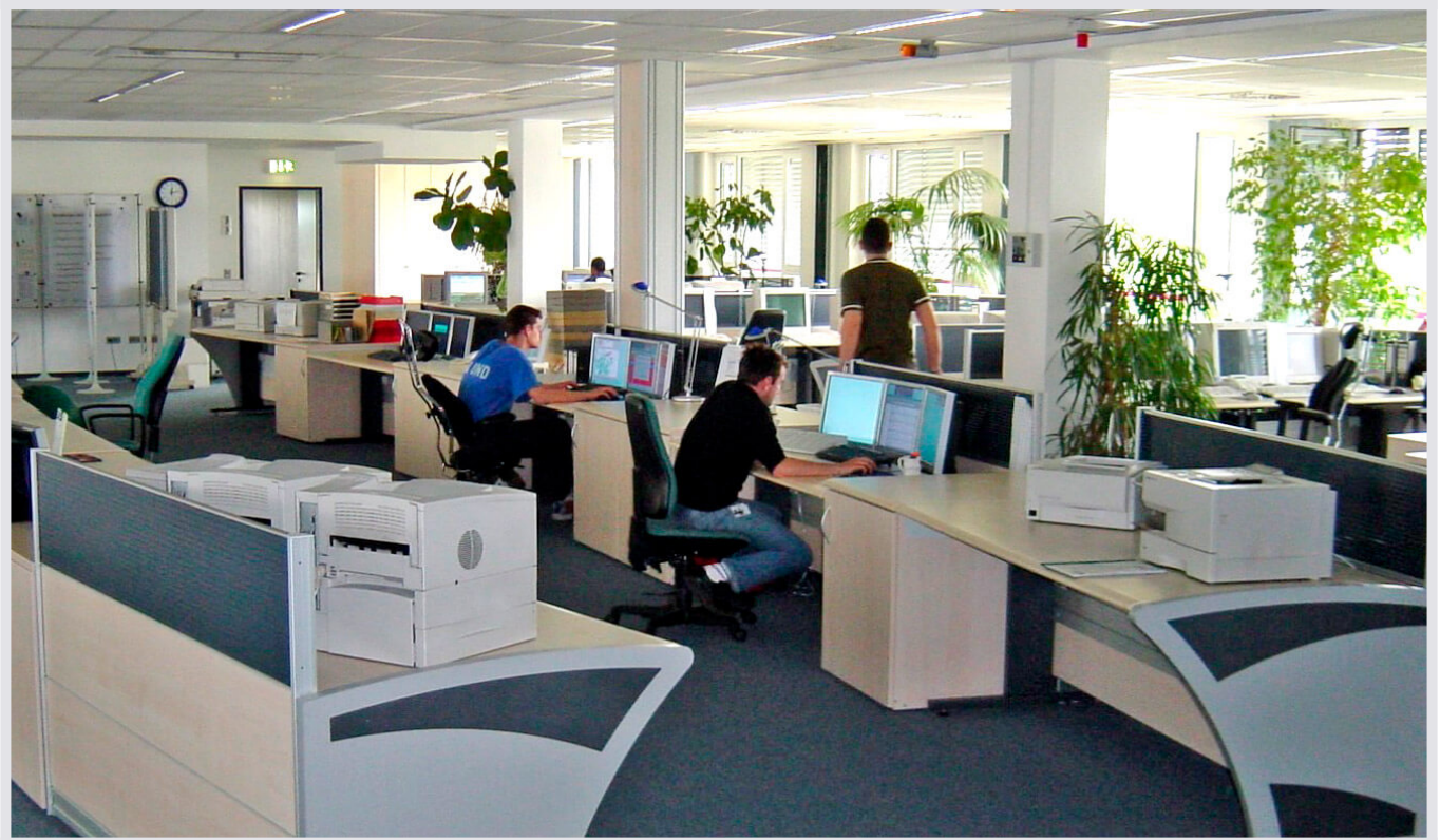
T-Mobile Berlin. Netzüberwachungscenter von JST.

Komplettsystem von JST zur Überwachung der T-Mobile Infrastruktur in der Nachtkonzentration.