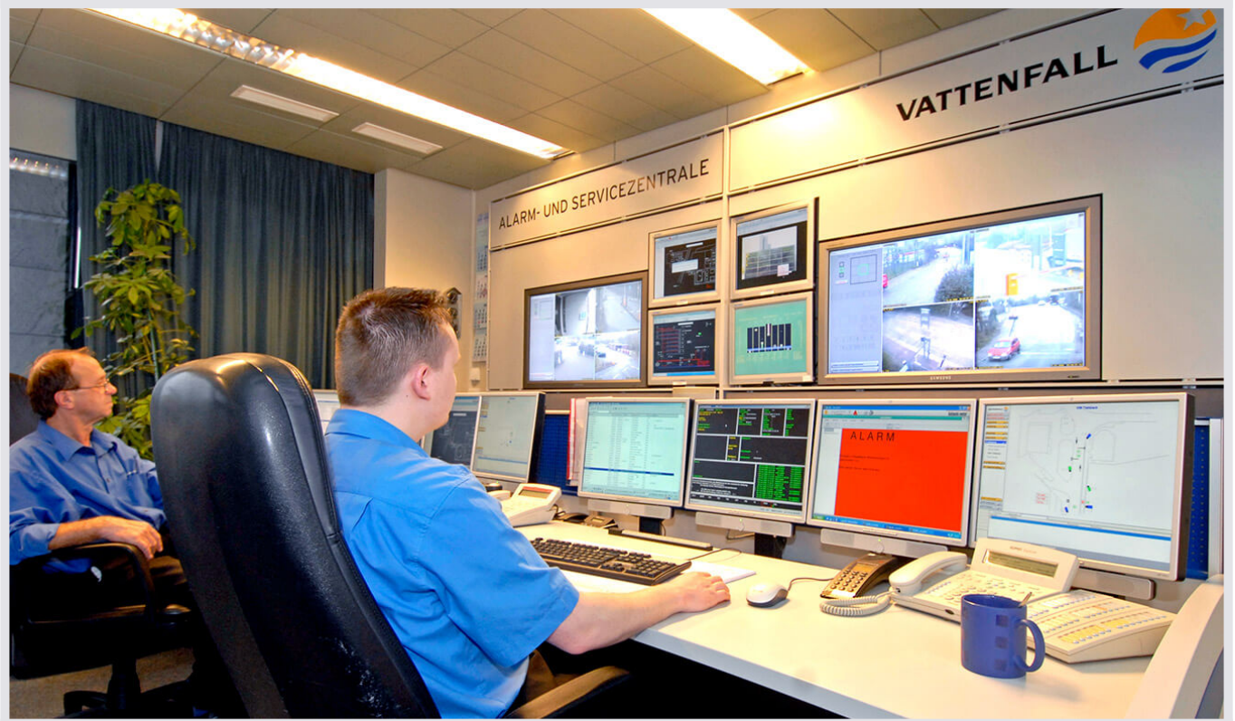
Vattenfall Hamburg: Alarm- und Servicezentrale von JST

Die Mitarbeiter der Alarm- und Servicezentrale , organisieren schon seit Jahren die Sicherheit vieler Betriebsanlagen von Vattenfall in Hamburg. Und das rund um die Uhr, 24 h/365 Tage.