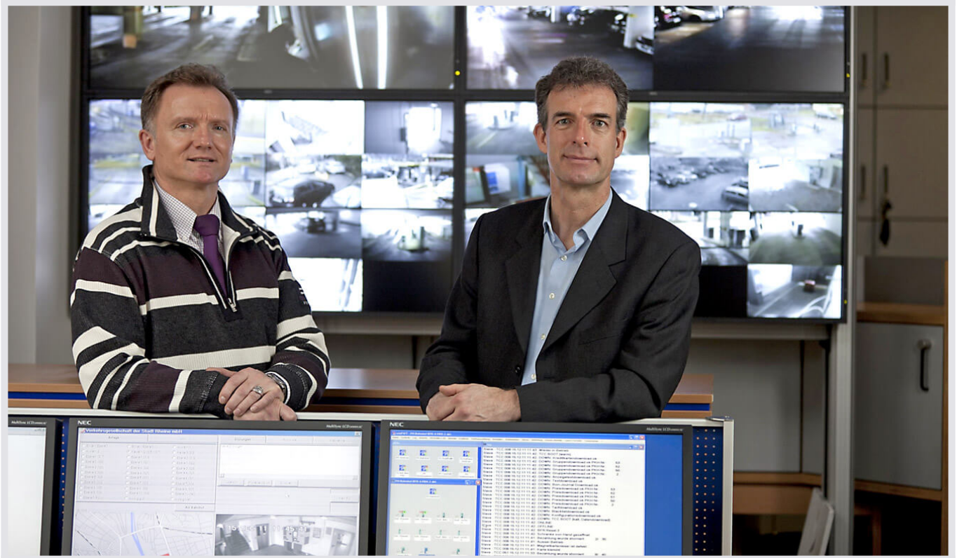
Verkehrsgesellschaft der Stadt Rheine: Parkraum-Leitwarte

Rund 80.000 Menschen leben in ihrem Einzugsgebiet, sind dort mit Bus, Fahrrad oder natürlich mit dem eigenen Kraftfahrzeug unterwegs. Als Tochter der Stadtwerke Rheine GmbH kümmert sich die Verkehrsgesellschaft der Stadt Rheine mbH darum, dass all diese Menschen und selbstverständlich auch die Besucher der Stadt ausreichend Parkraum vorfinden. Und genau dies ist der Dreh- und Angelpunkt in der aktuell neu ausgestatteten Leitwarte der Stadtwerke.