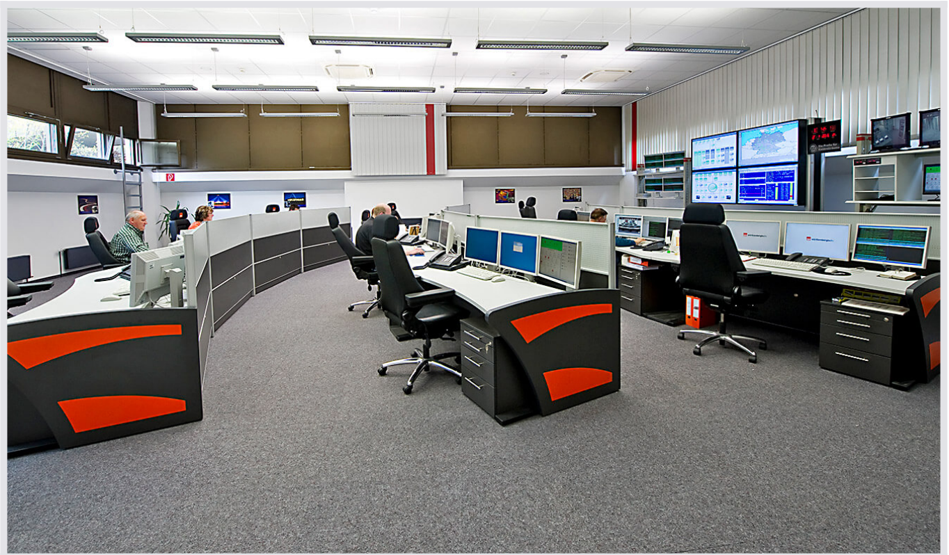
W&W Informatik Ludwigsburg: neuer Leitstand

Als zentraler IT-Dienstleister der Wüstenrot & Württembergische-Gruppe ist die W&W Informatik GmbH (WWI) verantwortlich für die Entwicklung von Anwendungen und Architekturen sowie den Betrieb von Netzen, zentralen und dezentralen Systemen und Rechenzentren. Derzeit beschäftigt die W&W Informatik gut 860 Mitarbeiter.